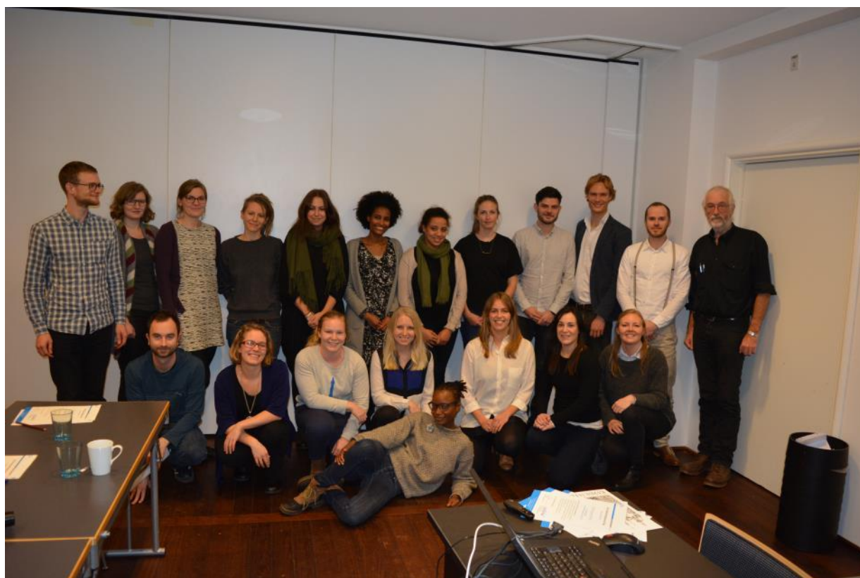
Nogle af deltagerne i IDA Global Development Class 2015 ved Close-out eventen 10.12.2015