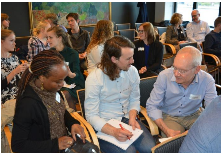
Fra ebola mødet 27.05.2015

Fra flere sider blev det foreslået at indsatsen i nærområderne skulle styrkes. Et arrangement i oktober analyserede hvad dette i praksis ville mene og hvad var de hidtidige erfaringer med denne type indsats. Udover disse havde selskabet et antal analyserende og dybdegående specialarrangementer: 'Foreign agri-business in Africa'; 'Fornyelsen af Danidas privatsektor