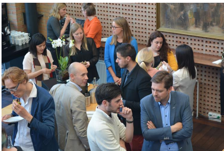
'Mingling' ved IDA Global Development Class 2015 – private-for-profit sector event 03.06.2015

Som det ses af tabel 2, afholdt selskabet succesfuldt arrangementer inden for de tre første af disse business lines. Igennem året blev mulighederne for business line 4 "ERFA net" undersøgt med den konklusion, at et erfaringsnetværk i traditionel forstand nok ikke ville være den bedste vej frem, da der fra flere sider blev rapporteret om lignende netværk, der havde svært ved at komme i gang. Den foreløbige konklusion er at prøve at lave korte og fokuserede web-baserede arrangementer med et indhold målrettet ansatte i privatsektoren. Arbejdstitlen for denne serie arrangementer er "Private virtual". Grundet det store arbejdspress med førstegangsimplementeringen af IDA Global Development Class 2015 havde bestyrelsen imidlertid ikke kapacitet til at få "Private virtual" i gang i 2015.